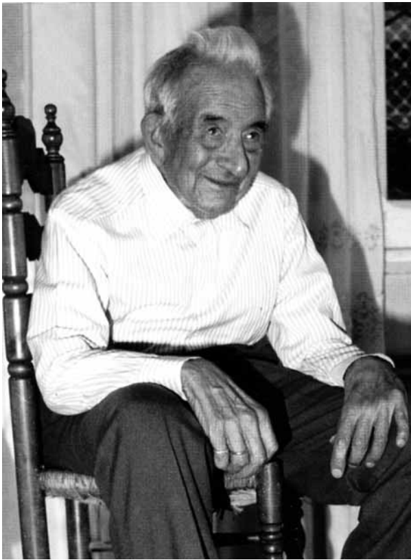
Joan Coromines a casa seva (Pineda de Mar, octubre de 1993)